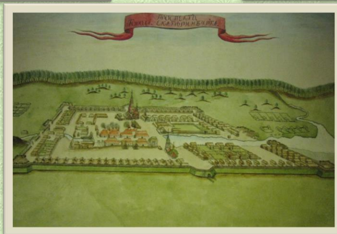
И. Ушаков. Екатеринбург. 1734год