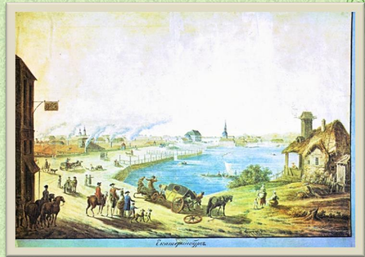
В.П. Петров. Екатеринбург (заводская плотина) 1789год.