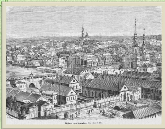
Общий вид города Екатеринбурга.